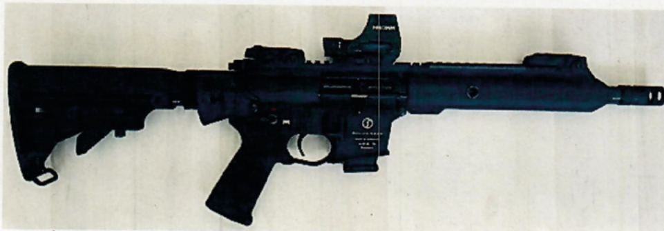
Abbildung 2: Schmeisser, „AR 15 Sport 9S“ mit Standard AR 15 Schubschaft und einem NOREC Mündungskompensator