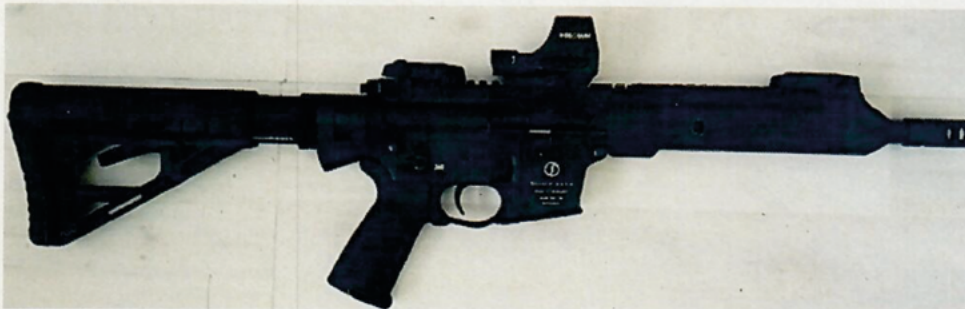
Abbildung 1: Schmeisser, „AR 15 Sport 9S“ mit Schmeisser Schubschaft und einem NOREC Mündungskompensator

Ausschlussgründe vom sportlichen Schießen gemäß § 6 AWaffV vorliegen.